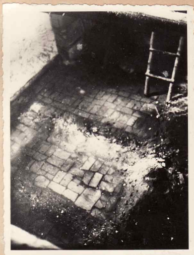
1. Urmele vechii pardoseli de cărămidă găsită sub dușumeaua de scânduri.