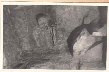
28. (1819) Părean Nord - m. 2 x 6