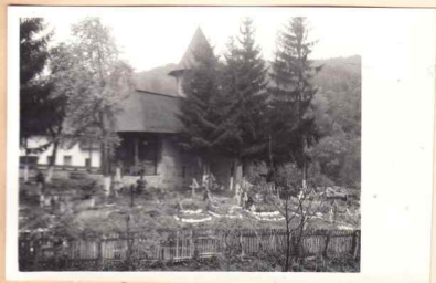
7. vedere sud-vest