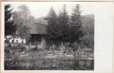
7. vedere sud-vest

BRADETU Judetul Arges Anul 1967 Inv. 1290R