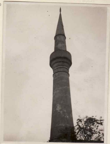
2. Vedere cu minaret (construit din cărămi- dă)