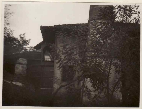
2. Vedere exterior