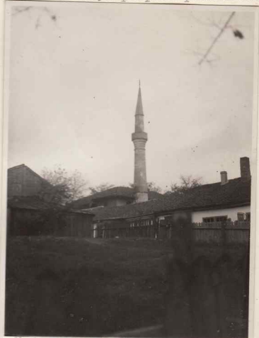
1. Vedere generală

(Clădită la 1851 propusă pentru dărâmare