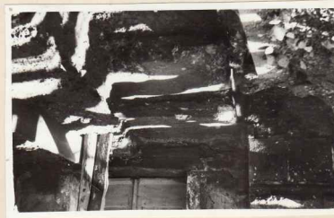
40. Biserica mare, sondaj intrare N. | 41. Biserica mare, sondaj intrare nord.