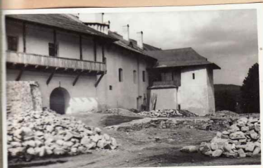
28. Chilii latura sud. Fațada nouă exterioară.