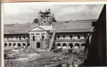
19. Biserica nouă mică - Sf. Gheorghe în timpul încorporării în incintă est.