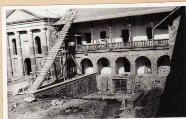
21. Cămin sud est - chilii și fațada v. Porții Mici. Incieta