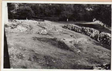
33. Pisania oligiarniței din 1548 / 20. Curtea exterioră latura sud