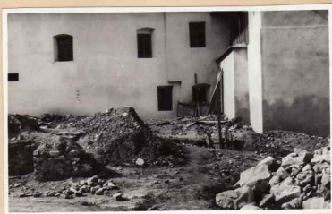
26. Chilii sud. Fațada sud