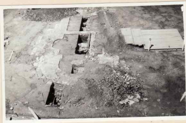
38. Fundațiile bisericii Sf. Gheorghe. 39. Fundațiile bisericii Sf. Gheorghe (dărămată)