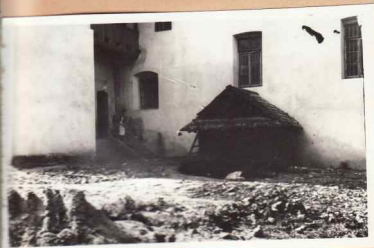
25. Intrarea la beci sub trapeză (chilii sud)