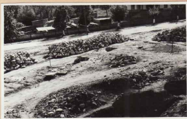
34. Desen după inscripția raclei (dis- 23. Chilia sud. Curte exterioră în părută de mult) a moaștelor Sf. Simion derptul bucătăriei. dată de Ștefan cel Mare la 1463