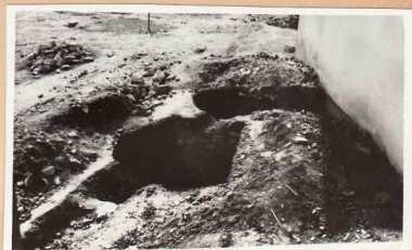
22. Fațada spre exterior în fața buci țării (chilii sud)