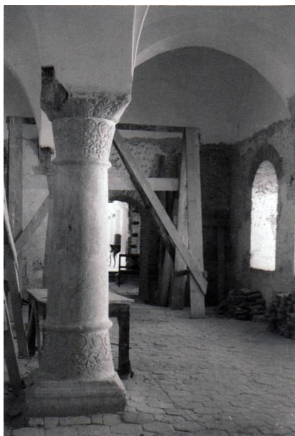
Sala Brâncoveanu Foto arh. Eugenia Greceanu 1962, Arhiva INP, Fond DMI;